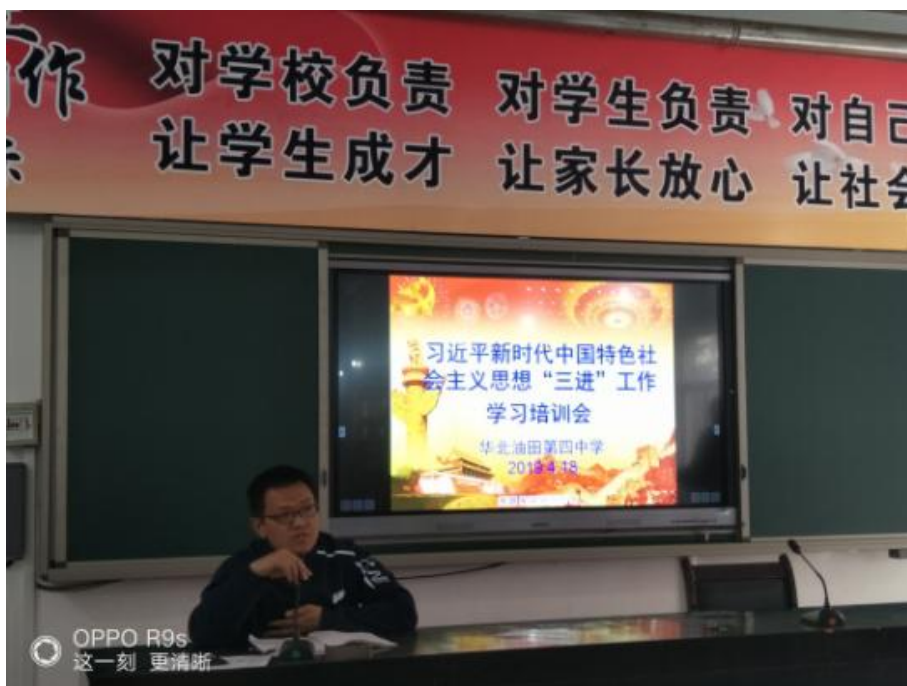
第四中学召开“三进”工作学习培训会